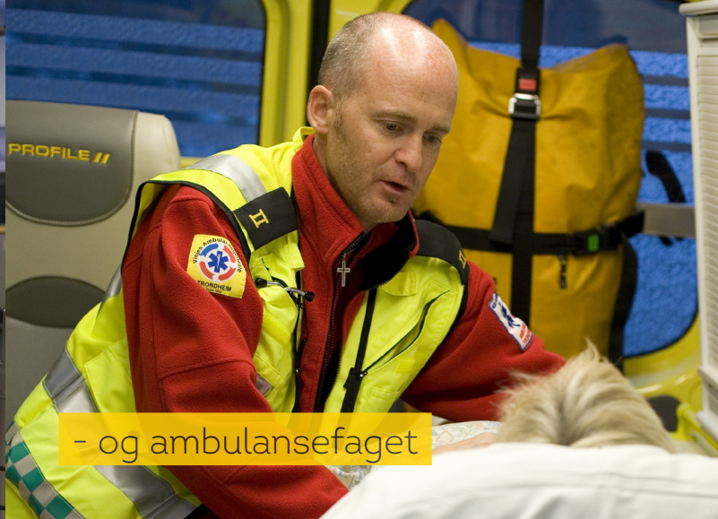
- og ambulansetjenesten

Fortsettelse program tirsdag 27. september 2016