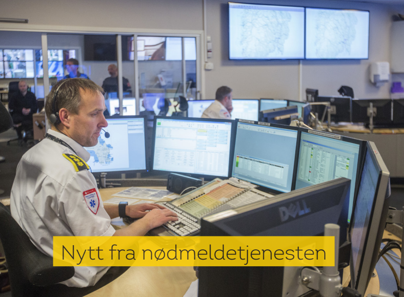
Nytt fra nødmeldetjenesten