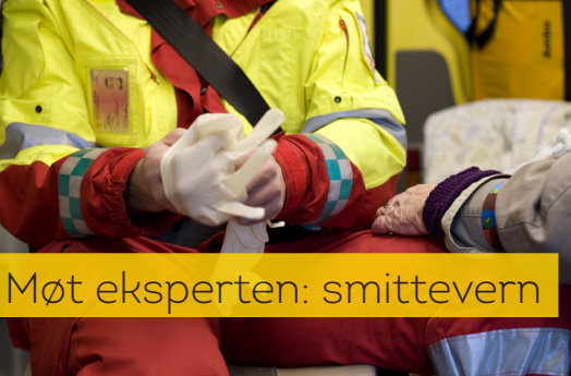
Møt ekspert: smittevern